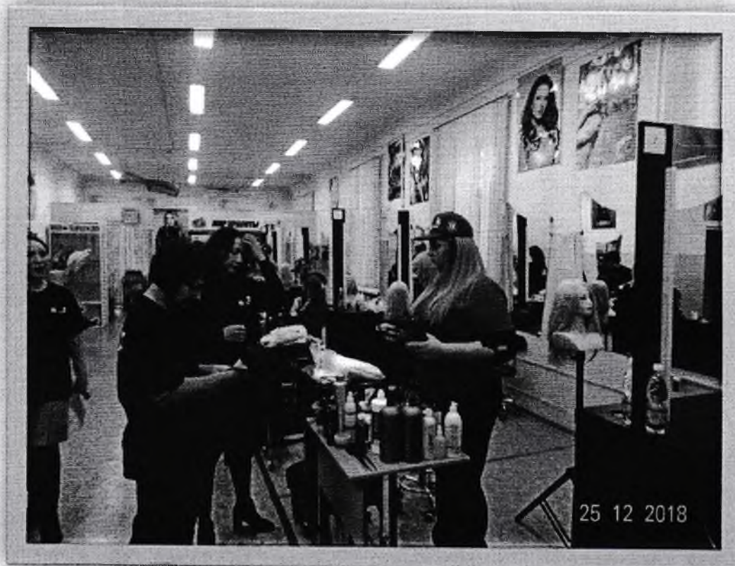
ПЛОЩАДКА КОМПЕТЕНЦИЯ ПАРИКМАХЕРСКОЕ ИСКУССТВО